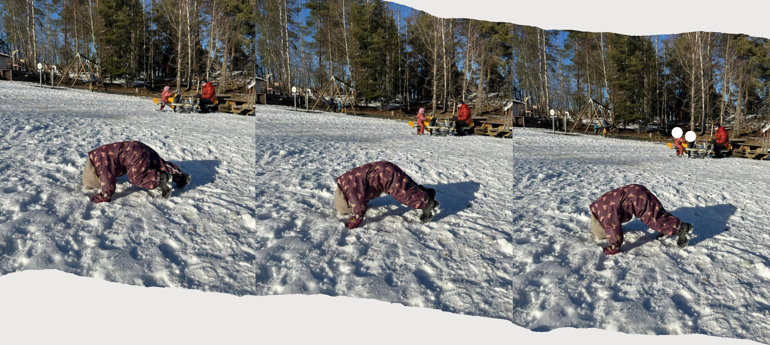
Noen blinkskudd fra bildeserien: Yoga i snøen 😊